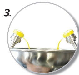
3. มีกรองฝุ่น และฝาปิด ที่วาล์วล้างตาในตัว