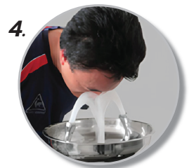
4. ใช้งานง่าย ในการชำระล้างดวงตา