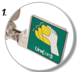
1. มีปลั๊กวาล์วขนาดใหญ่ เปิดใช้งานง่าย